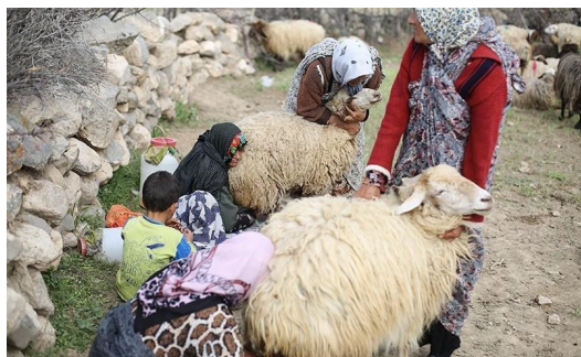
شکل ۲: سوتچیلر در حال انجام عمل شیر دوشی

گرفته می‌شود؛ که این قسمت (شیردوشی) در کشورهای پیشرفته به صورت مکانیزه انجام می‌شود تا زمان و نیروی کار کمتری صرف شود؛ که در منطقه مورد مطالعه نیز شاهد آن هستیم. "شیر پز" شخصی است که از اهالی روستا نیست ولی یک ماه از بهار و سه ماه تابستان برای خریداری شیر دام روستائیان به همراه نیروی کمکی خود با نرخ‌ی که با ریش سفیدان و سردسته‌ها به توافق رسیده به روستا می‌آید، شیر پز ممکن هر سال بنا به تصمیم روستائیان تغییر کند. شیر در همان محل مذکور به فرآورده که عمدتاً پنیر می‌باشد تبدیل شده و وارد بازار می‌شود.