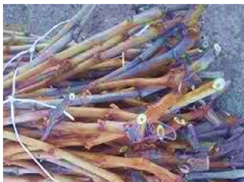
شکل ۵: شاخه‌های درخت تاک مورد استفاده برای ساخت "اولچی"