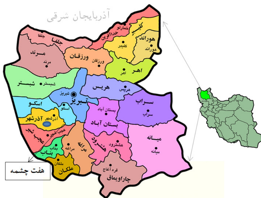
شکل ۱: موقعیت جغرافیایی منطقه مورد مطالعه در تقسیمات کشوری

۲۰ کیلومتری شهرستان آذرشهر در دهستان قبله داغی، بخش حومه، با ۱۷۵۵ نفر جمعیت با مختصات جغرافیایی "۳۷°۳۸'۶۰" شمالی "۳۵°۵۷'۴۵" شرقی مورد بررسی قرار گرفته که در این روستا از گذشته دامداری و کشاورزی شغل اصلی اهالی آن محسوب می‌شده. در این روستا بیشتر کارهای که به زمان و هزینه زیادی نیاز دارد با مشارکت اهالی روستا در قالب یک برنامه خاص که از گذشته به ارث مانده، در کمترین زمان ممکن و با هزینه مناسب انجام می‌پذیرد که یکی از آن‌ها نظام گله‌داری می‌باشد. روستای مذکور، خود از سه دسته بنام‌های دسته دیزج (دسته بالایی)، دسته میدان (دسته وسطی)، دسته قنبرآباد (دسته پایینی)، تشکیل شده است که همکاری و همیاری