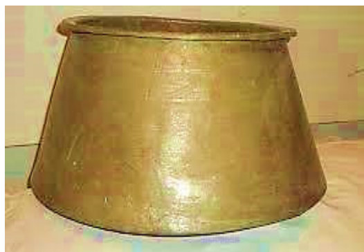
شکل ۴: قازانچا برای جمع‌شدن شیر دوشیده شده از دام

بعد از اتمام فصل تابستان و هنگام شروع فصل پاییز که مقدار شیر دام کاهش یافته و کیفیت آن نیز به خاطر خشک شدن علوفه تغییر کرده، شیر پز روستا معمولاً حساب خود را با اهالی صاف کرده و از روستا می‌رود تا اگر سال بعد هم با ریش سفیدان به توافق رسیدند، دوباره برای خریداری شیر به روستا برگردد؛ اما اگر اهالی روستا از او راضی نباشند، سران دست‌ها و ریش سفیدان، برای سال بعد با شیر پز دیگری مذاکره می‌کنند. در هنگام پاییز که شیر پز در روستا نیست، هر چند که مقدار شیر کاهش یافته ولی همه‌ی قوانین شیردوشی پابرجا بوده و بده بستان و عوض کردن شیر توسط شیر رفیق‌ها همچنان ادامه می‌یابد تا زمانی که دام‌های خشک شوند و دیگر شیری برای دوشیدن نداشته باشند. در این فصل زنان با سهم شیر خود برای اعضای خانواده پنیر و ماست و دیگر فرآورده‌های لبنی را درست می‌کنند. همچنین برخی از آن‌ها با قسمتی از سهم شیر خود، نوعی آش محلی درست کرده و در روستا پخش می‌کنند. این آش را در گویش محلی "سوتدی آش" ۳ می‌گویند که بسیار خوشمزه می‌باشد. برخی از زنان نیز با سهم شیر خود پنیر ساخته و مقداری را که خانواده نیاز دارد در ظروف مخصوص برای مصرف خانواده نگه می‌دارند و بقیه آن را فروخته و با پول آن برای خانواده اقلام ضروری دیگری را تأمین می‌کنند؛ و این چنین در زندگی خود در قالب گروه‌های سنتی با همکاری و همیاری متقابل بسیار دقیق و